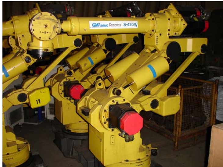
Abbildung eines S-420 W Modells mit 150 KG Traglast Sie bieten auf einen S-420F mit 120 KG Traglast

Handlingaufgaben, Polieren, Palettieren, Maschinenbeladung/ entladung, u.v.m.